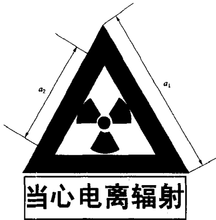
图 F2 电离辐射警告标志

电离辐射的警告标志如图 F2 所示。警告标志的含义是使人们注意可能发生的危险。其背景为黄色，正三角形边框及电离辐射标志图形均为黑色，“当心电离辐射”用黑色粗等线体字。正三角形外边 a_1=0.034L ，内边 a_2=0.700a_1 ， L 为观察距离。